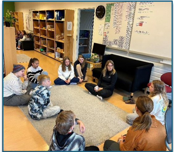
Gruppesamling i mellomtrinn

Dermed er montessorimateriellet både tradisjonelt, men også fleksibelt og framtidsrettet.