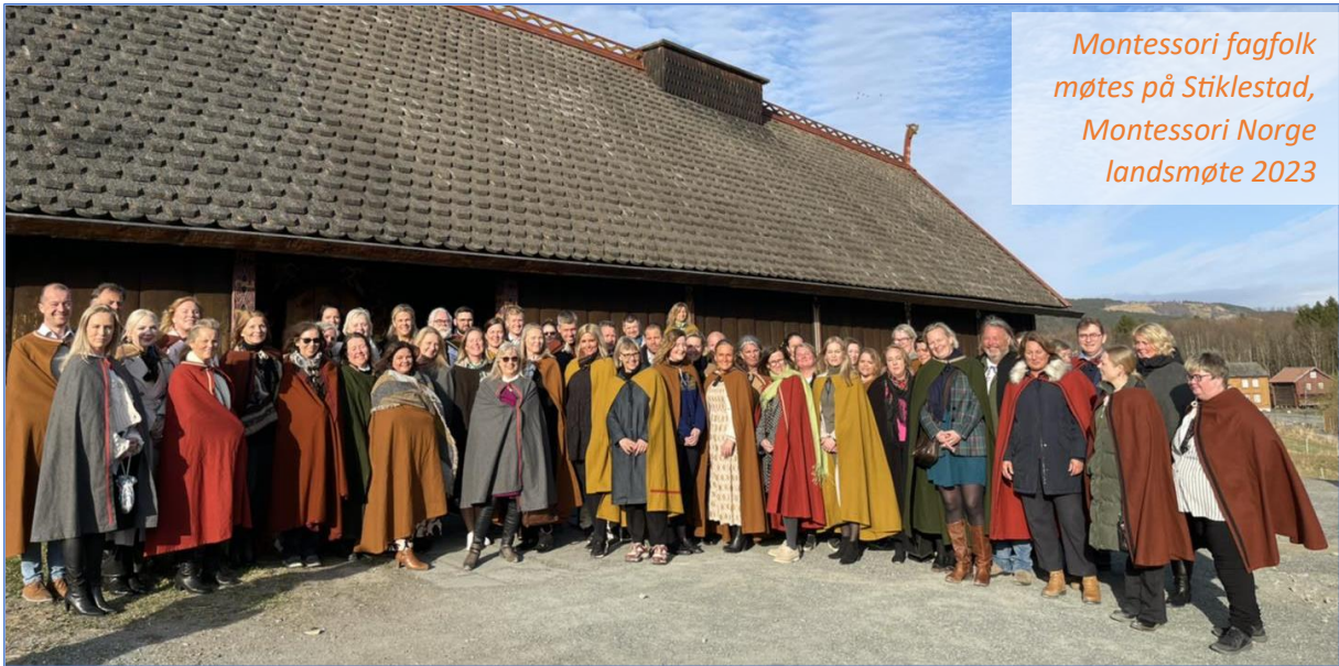
Montessori fagfolk møtes på Stiklestad, Montessori Norge landsmøte 2023