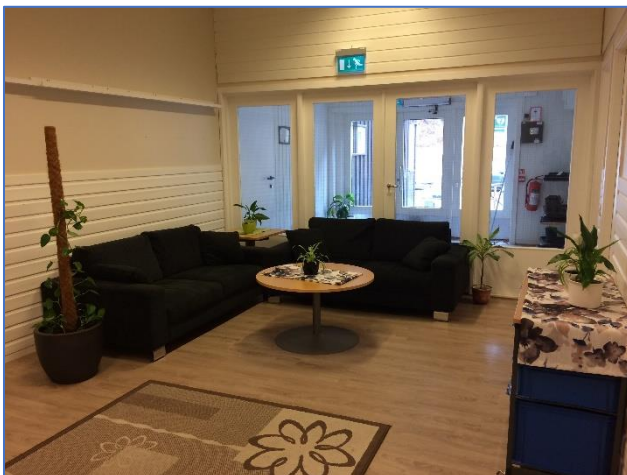
Gang og grupperom, Helgådal Montessori

Montessori Trøndelag ble etablert i 2019, med det viktige formålet om å fremme samarbeid mellom montessorienheter i regionen, og var dessuten vertskap for landsmøtet.